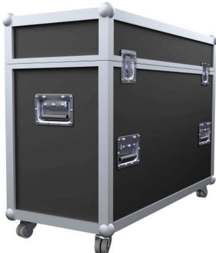
SL 75 FlightCase mit sehr geringen Packmaßen von nur 105 x 44 x 86 cm.