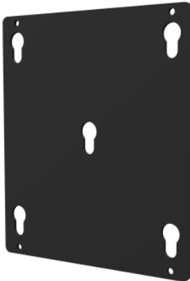
MS Audipack Adapter Platte.