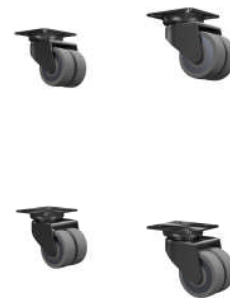
4 Schwerlast-Rollen. Optional für die Bodenplatte.

Case Weight: 46kg, 101 lb Case Dimensions: 1203 x 513 x 852 mm 47,3 x 20,2 x 33,5 inch