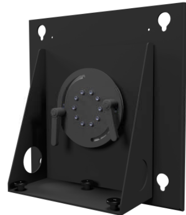
Säulenkopf mit integrierter 90° Rotation Nur in Verbindung mit MS VESA Halterung.