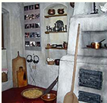
Aschenbrödels Küche CF Player® im Märchenland